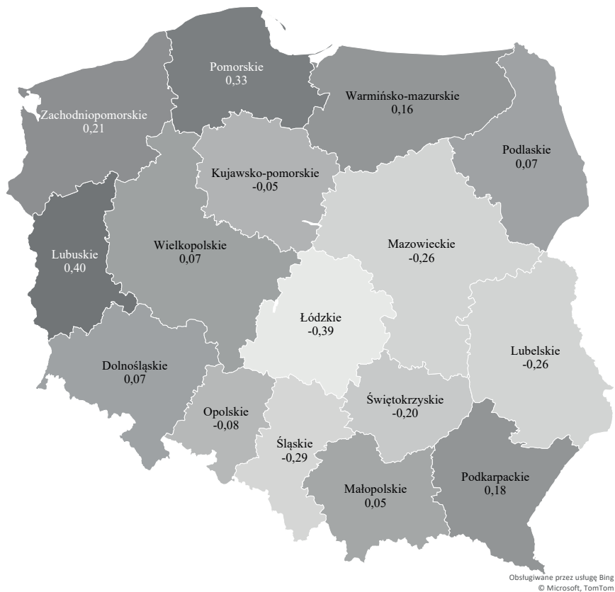
RYSUNEK 3: Wartość syntetycznego wskaźnika Perkala dla poszczególnych województw Polski w 2015 r.