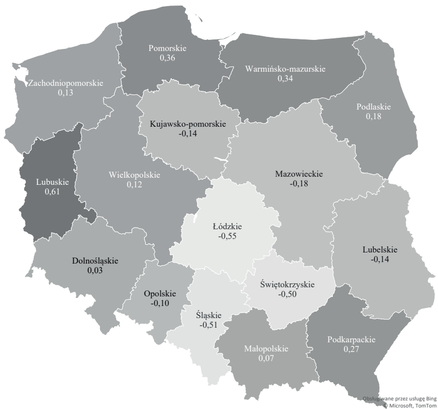
RYSUNEK 4: Wartość syntetycznego wskaźnika Perkala dla poszczególnych województw Polski w 2022 r.