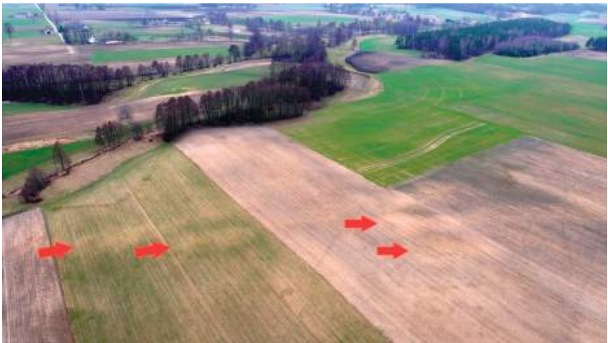
Ryc. 4. Lubomin, gm. Boniewo. Lokalizacja grobowców kujawskich w południowej części stanowiska na podstawie wyróżników glebowych