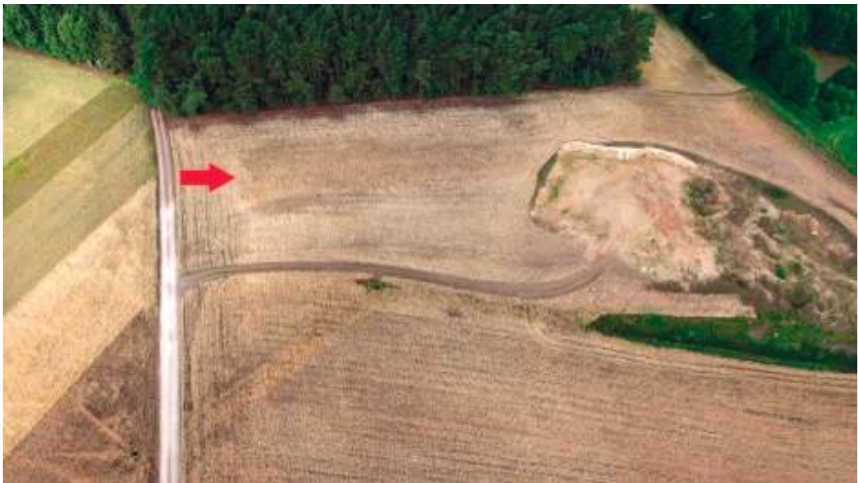
Ryc. 2. Janiszewo, gm. Lubraniec. Prawdopodobna lokalizacja grobowca kujawskiego na podstawie zaobserwowanego wyróżnika wegetacyjnego