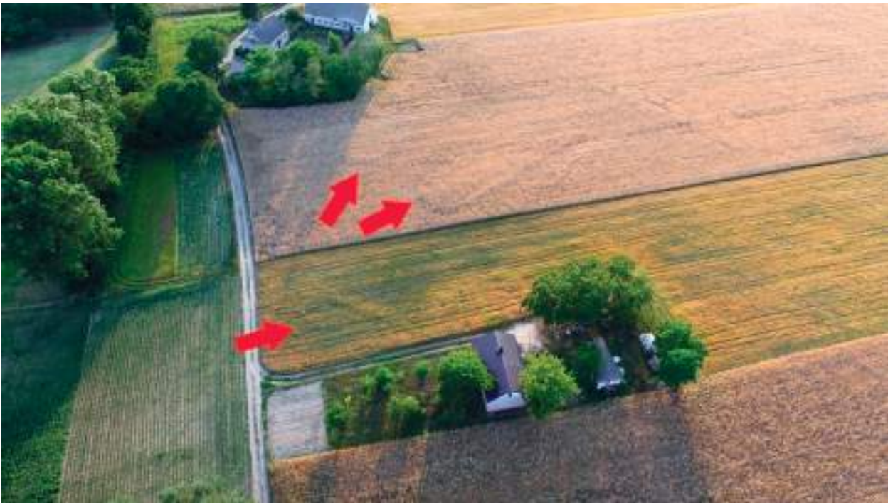
Ryc. 1. Dęby Janiszewskie, gm. Lubraniec. Wyróżniki wegetacyjne wskazujące na lokalizację grobowców kujawskich

niż nawet kilkurazowy przelot samolotem nad interesującym nas obszarem. Pełna kontrola nad parametrami lotu takimi jak: pułap oraz kąt z jakiego robione jest zdjęcie pozwala na uzyskanie maksymalnej ilości informacji. Dodatkowo możliwość zawisu pozwala na wykonanie większej ilości szczegółowych ujęć. Podczas kilkunastominutowego nalotu można wykonać nawet do kilkuset zdjęć. Ten sposób prospekcji lotniczej wykorzystwała Fundacja Badań Archeologicznych Imienia Profesora Konrada Jażdżewskiego realizując program: „Źródła archeologiczne w rejonie Parku Kulturowego Wietrzychowice”. W jego ramach postanowiono między innymi dokonać ponownej lokalizacji grobowców kujawskich znanych ze źródeł pisanych oraz tych, które zostały przebadane przez profesora Konrada Jażdżewskiego w latach 30-tych ubiegłego wieku. Sprzęt jaki został użyty do wykonania fotografii to bezzałogowy dron - octokopter na platformie DJI S1000, wyposażony w gimbal Zenmuse Z15 z aparatem Panasonic GH 3 oraz obiektyw Olympus M. Zuiko Digital ED 12 mm f.2.0. Ogółem w okresie od sierpnia 2014 do lipca 2017 roku wykonano ponad 7500 fotografii na obszarze o łącznej powierzchni około 15 km 2 w okolicy Izbicy Kujawskiej i Lubrańca. Zdjęcia wykonywano w różnych porach roku (od lutego do października) w celu uchwycenia tzw. wyróżników roślinnych lub glebowych, w różnych warunkach naświetlenia i w różnych okresach wegetacji poszczególnych upraw. W zależności od potrzeb pułap poszczególnych lotów wahał się od