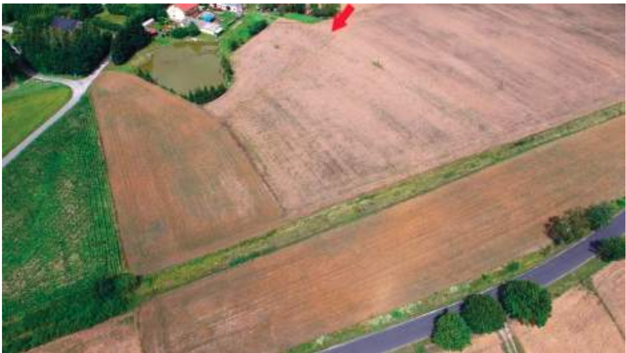
Ryc. 6. Leśniczówka (obecnie Arciszewo), gm. Boniewo. Wyróżnik wegetacyjny wskazujący prawdopodobną lokalizację grobowca nr V

Prospekcją lotniczą objęto również inne tereny w gminie Izbica Kujawska oraz gminach ościennych. W kilku przypadkach zarejestrowano różnego rodzaju wyróżniki, które ze względu na swoje rozmiary oraz kształt mogą wskazywać na obecność reliktyw grobowców kujawskich. Jako przykład takiego obiektu może służyć anomalia zaobserwowana w miejscowości Gaj. Znajdowała się ona 700 m na południowy – wschód od grobowca nr 1 w tej miejscowości i miała wyraźny trapezowaty kształt o długości około 35 m z osią wzdłużną na linii N-S (ryc. 14). Na pytanie czy mamy tutaj do czynienia z kolejnym megalitem, odpowiedź mogą dać dodatkowe badania nieinwazyjne np. geomagnetyczne. Obecnie trwają prace nad odnalezieniem megalitów w Komorowie, Wólce Komorowskiej, Tymieniu i Skarbanowie. Do chwili obecnej wykonano blisko 130 lotów a łącznym czasie ponad 22h. Wykonano blisko 7500 fotografii o pojemności około 65 GB.