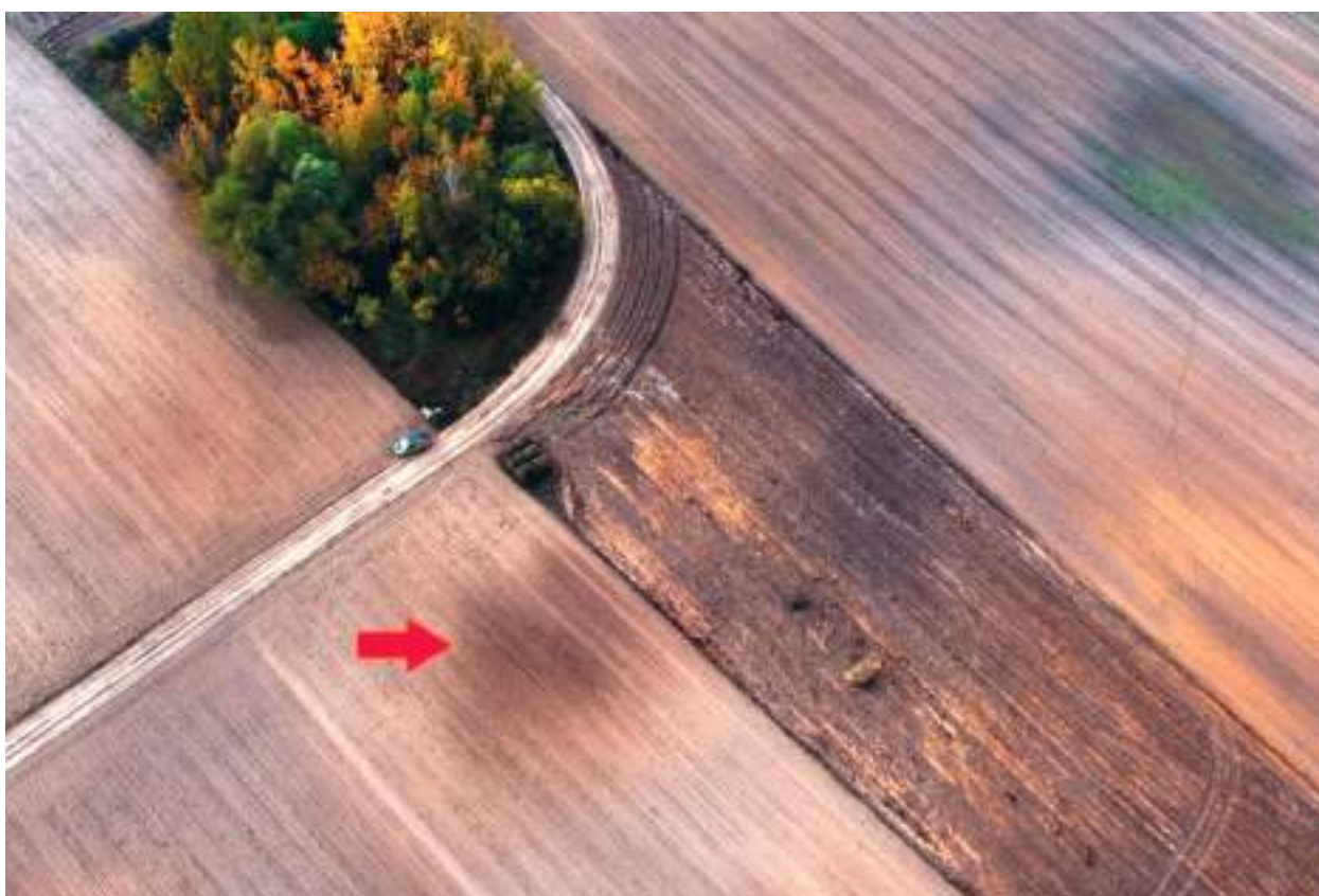
Ryc. 8. Obałki, gm. Izbica Kujawska. Lokalizacja jednego z dwóch okrągłych kurhanów odkrytych przez profesora Konrada Jażdżewskiego