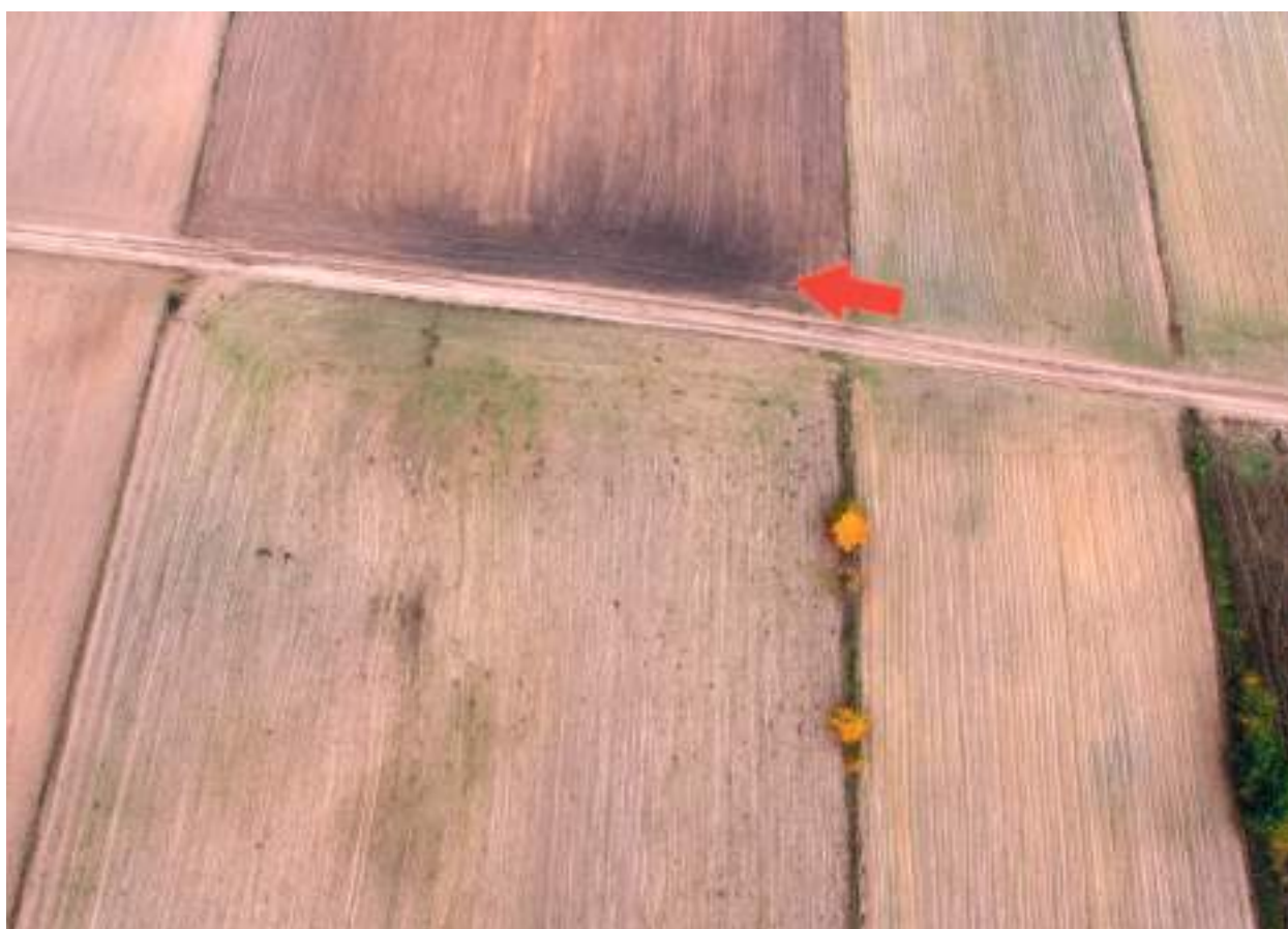
Ryc. 10. Obałki, gm. Izbica Kujawska. Prawdopodobna lokalizacja grobowca nr IV