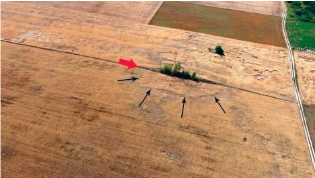
Ryc. 3. Lubomin, gm. Boniewo. Lokalizacja grobowca kujawskiego w północnej części stanowiska. Czarnymi strzałkami zaznaczono zasięg piasznicy, która zniszczyła wschodnią część megalitu

około 60 ha wokół tego zgrupowania. Dzięki wykonanym o różnych porach roku fotografiom udało się ustalić dokładną lokalizację poszczególnych megalitów w obrębie cmentarzyska. Jak się okazało grobowiec, który został sfotografowany w 1935 roku nadal manifestuje się w terenie, jednak został od tego czasu poważnie uszkodzony. Obiekt ten znajduje się obecnie na miedzy rozdzielającej pola, a jego wschodnia część została zniszczona przez pobór piasku na przebudowę pobliskiej drogi Lubomin – Skarbanowo. Zachowała się jedynie część zachodnia, ale w chwili obecnej wysokość nasypu nie przekracza kilkudziesięciu centymetrów (ryc. 3). Podstawa tego megalitu była zwrócona na południe, a całkowita długość wynosiła około 54-58 m. Był on także obiektem niejako odseparowanym od pozostałych grobowców, które znajdowały się około 100 m dalej w kierunku południowym. Wykonane zdjęcia lotnicze ukazały rozorane, piaszczyste nasypy czterech tego typu obiektów ułożonych osiami wzdłużnymi po linii wschód – zachód z podstawami na zachód (ryc. 4). W przypadku dwóch z nich, prospekcja lotnicza pozwoliła także dostrzec niewielkie zaciemnienia w partii czołowej co może wskazywać na relikty tzw. budynków kultowych często lokowanych w tej partii megalitów. Niewykluczone, że w pobliżu pary megalitów w południowo – zachodniej części stanowiska znajduje się jeszcze jeden obiekt o charakterze sepulkralnym. Niestety ta część stanowiska również została mocno przekształcona w ostatnich latach i trudno jest określić