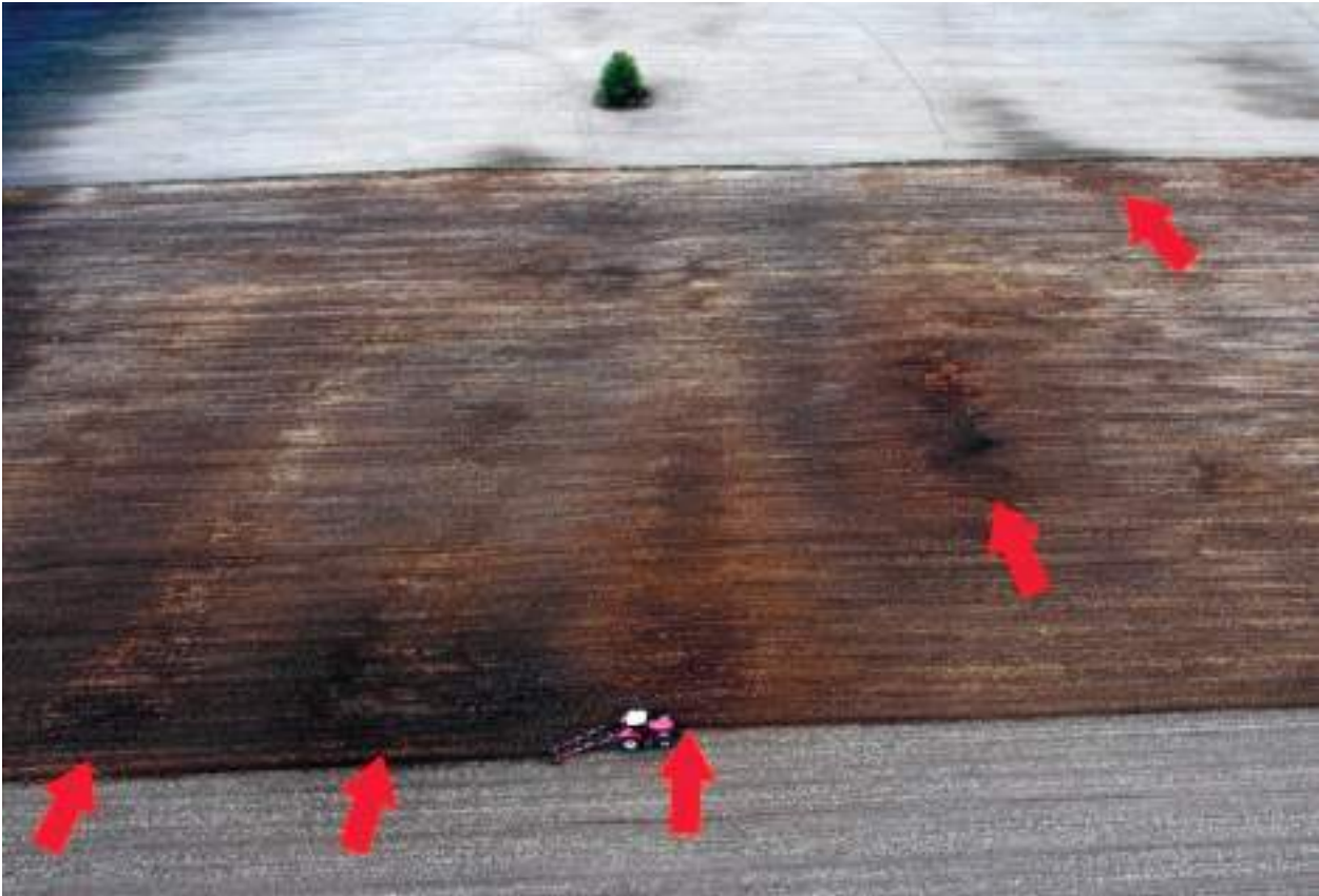
Ryc. 13. Łania, gm. Chodecz. Lokalizacja poszczególnych grobowców kujawskich w obrębie cmentarzyska