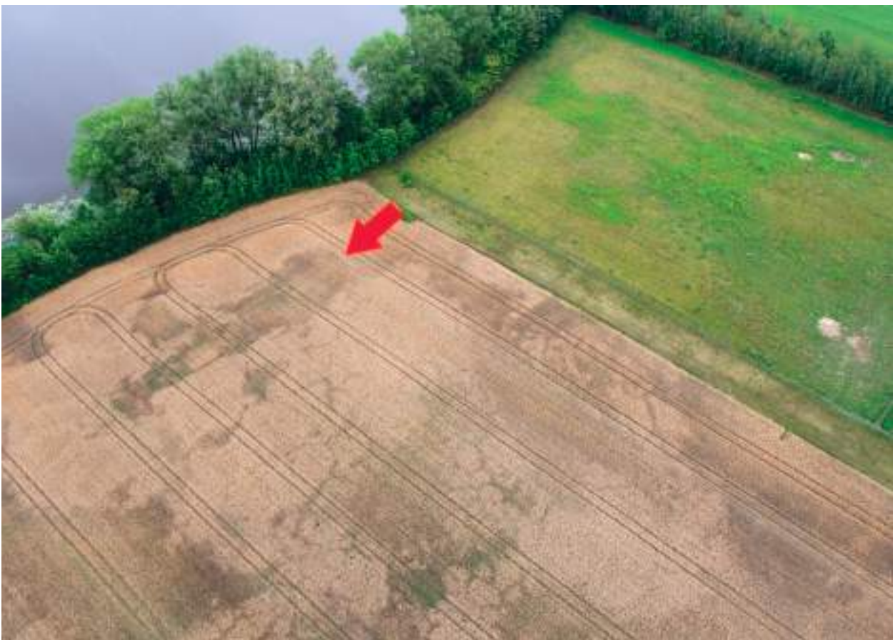
Ryc. 14. Gaj, gm. Izbica Kujawska. Trapezowaty wyróżnik wegetacyjny, który może wskazywać na obecność grobowca kujawskiego