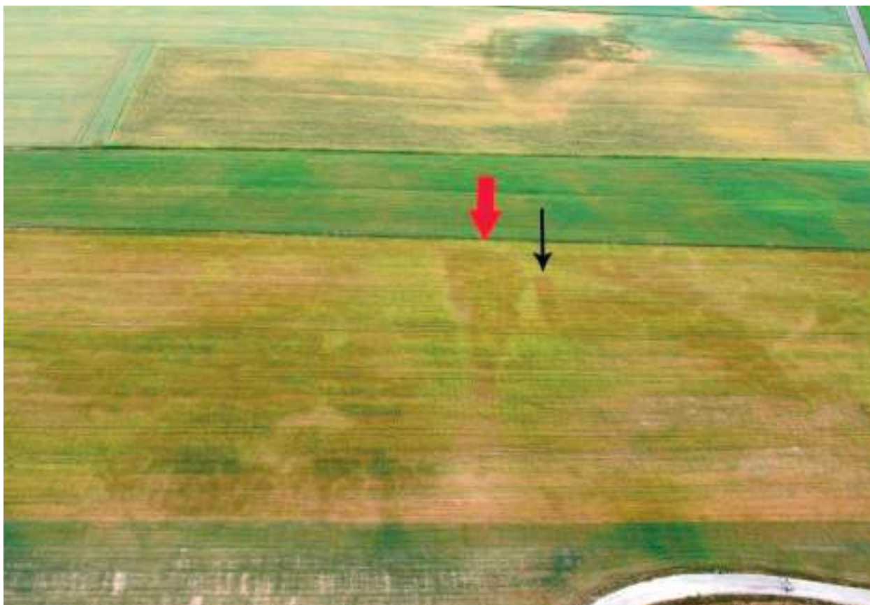
Ryc. 11. Śmiely, gm. Izbica Kujawska. Zarys grobowca kujawskiego zarejestrowany w czerwcu 2015 roku. Czarną strzałką oznaczono wykop sondażowy z 1969 roku