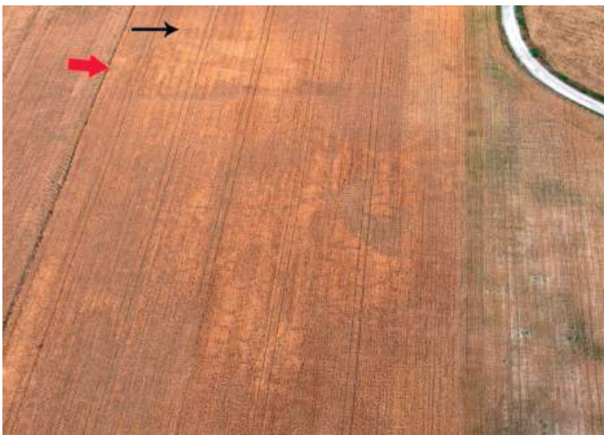
Ryc. 12. Śmiely, gm. Izbica Kujawska. Zarys grobowca kujawskiego zarejestrowany w lipcu 2015 roku. Czarną strzałką oznaczono wykop sondażowy z 1969 roku