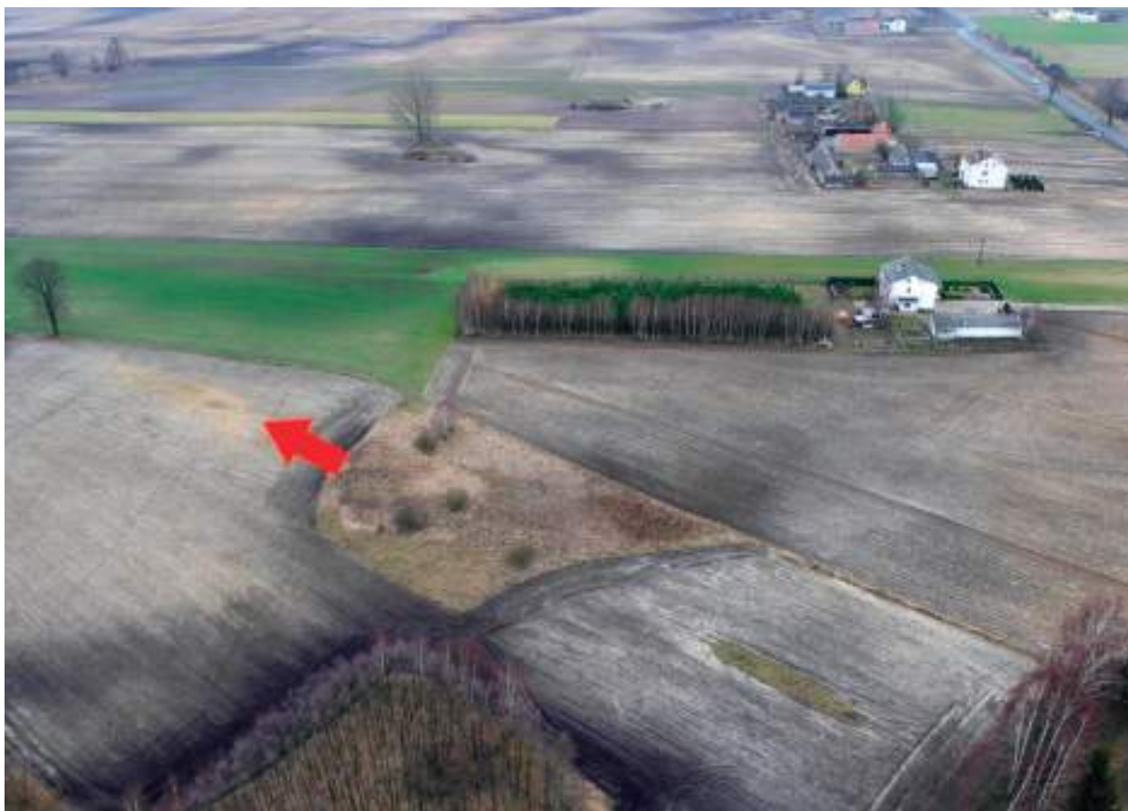
Ryc. 7. Leśniczówka (obecnie Arciszewo), gm. Boniewo. Lokalizacja grobowca kujawskiego oddalonego od centrum stanowiska o około 300 m