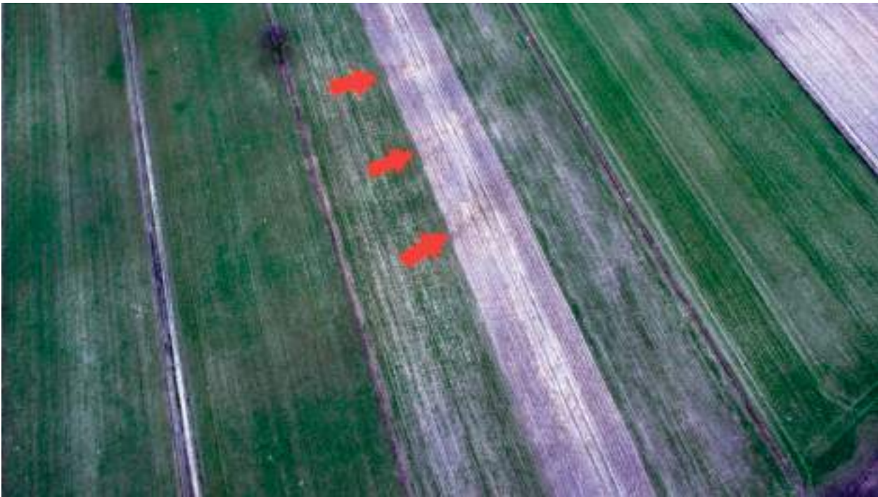
Ryc. 5. Leśniczówka (obecnie Arciszewo), gm. Boniewo. Wyróżniki glebowe wskazujące lokalizację grobowców nr I, III i IV

zaobserwować liniowe układy, które jak się wydaje odpowiadają lokalizacji poszczególnych megalitów ze zgrupowania, które badał profesor Jażdżewski (ryc. 9). W przypadku grobowca nr IV, który był oddalony od pozostałych o około 200 m w kierunku wschodnim, z pomocą przyszła analiza starych map oraz planów i szkiców sporządzonych przez profesora Jażdżewskiego. Na tej podstawie można uznać, że relikty tego megalitu o długości około 50 m znajdują się w pobliżu drogi łączącej Obałki z Kolonią Obałki (ryc. 10). Droga ta powstała po II wojnie światowej i jak się wydaje, częściowo przechodzi przez nasyp grobowca od strony południowej.