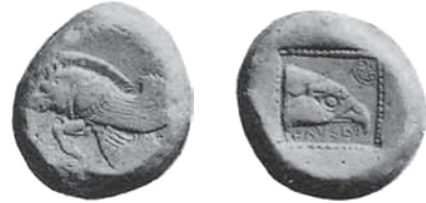
Fig. 2. Ialysos, ca. 515/510-500 p.n.e., AR, stater. Auctions-Catalog Hirsch XXV, Sammlung Philipsen, 1909, nr 2426

lene oraz Kyzikos. Na rewersach monet widnieje głowa orła, często w ramce perełkowej, w zagłębionym kwadracie 31 . Warto zauważyć, że w odróżnieniu od Lindos i Kamiros rewersu nie zajmują dwa zagłębione prostokąty, charakterystyczne dla mennictwa miast Karii. Na monetach pojawiła się nazwa polis w jońskiej formie IEΛYΣION (Fig. 3), zamienionej na IALYΣION (Fig. 4) 32 : umieszczono ją obok wizerunku głowy orła.