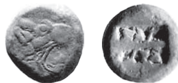
Fig. 7. Lindos, ca. 515/510-480 p.n.e., AR, stater. Naville & Cie, Catalogue X, 1925, nr 716

(Fig. 6) 39 . Motyw głowy lwa ukazanej w ten sposób wykorzystano również na monetach Samos, Miletu i innych ośrodków małoazjatyckich 40 . W niektórych przypadkach wskazywano na wpływ Samos na popularność tego motywu 41 . Na rewersie umieszczono dwa rozdzielone prostokątne zagłębienia o nieregularnym wypełnieniu. Podobny rewers widoczny jest na emisjach miast Karii, także ośrodków rozlokowanych na wyspach położonych wzdłuż południowo-wschodniego wybrzeża Azji Mniejszej. Opisany wyżej kształt rewersu utrzymany został długo, a pas między zagłębieniami wykorzystano do umieszczenia nazwy polis . Monety opisanego typu wybite zostały w indywidualnym standardzie wagowym Lindos.