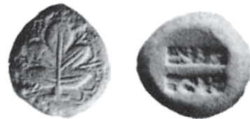
Fig. 11. Kamiros, ca. 525/520-500 p.n.e., AR, stater. Auctions-Catalog, Hamburger VII, 1908 nr 590

sze nominały (Fig. 12), na awersie których widnieje liść figi. Monety takie bito do około 470/460 r. p.n.e. w szerokiej gamie nominałów, od statera do hemiobola 50 . Przed końcem VI w. p.n.e. wybito w Kamiros monety elektronowe (Fig. 13) 51 . Ich ikonografia nie odbiegała od tej typowej dla srebra. Około 470/460 r. p.n.e. wprowadzono do obiegu srebrne monety z liściem figi na awersie i nazwą polis na stronie przeciwnej. Podaną ją w formie ΚΑΜΙΡΕΩΝ, na mniejszych nominałach stosowano skrót ΚΑ. Od 411 r. p.n.e., tak jak w pozostałych dwóch ośrodkach, produkowano monety, na awersie których pokazano głowę konia.