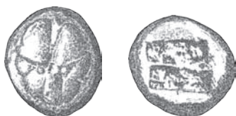
Fig. 6. Lindos, ca. 525/520-515/510 p.n.e., AR, drachma. Według: Wells 1981. Rys. E. Wtorkiewicz-Marosik

Kolejna zmiana nastąpiła około 470 r. p.n.e. i związana była z wpływami Aten będącymi wynikiem członkostwa Ialysos w Związku Morskim. Z tego tytułu na rewersach monet w zagłębionym kwadracie umieszczono głowę Ateny w hełmie (Fig. 5). Modyfikacji ikonografii towarzyszyła zmiana standardu wagowego. Diobole, obole i hemiobole wybijano w standardzie attyckim. Widoczna w tym okresie przewaga emisji niskich nominałów mogła być skutkiem polityki Aten.