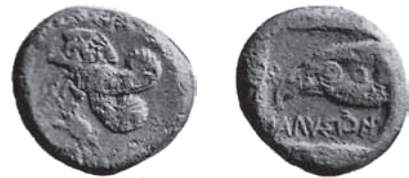
Fig. 4. Ialysos, ca. 500-480 p.n.e., AR, stater. Auctions-Catalog Hirsch XVIII, 1907, nr 2483