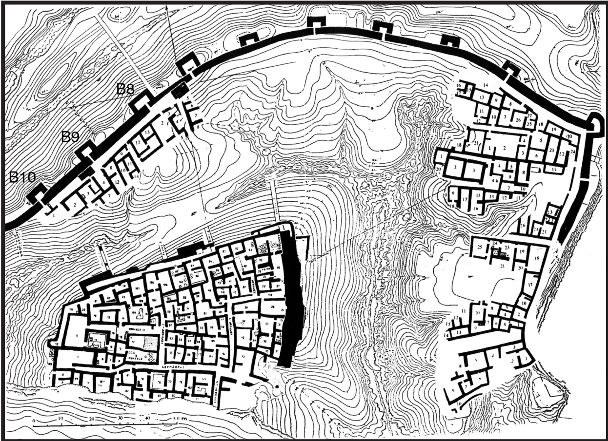
Kampyr-tepe. Rusanov 2000: 31