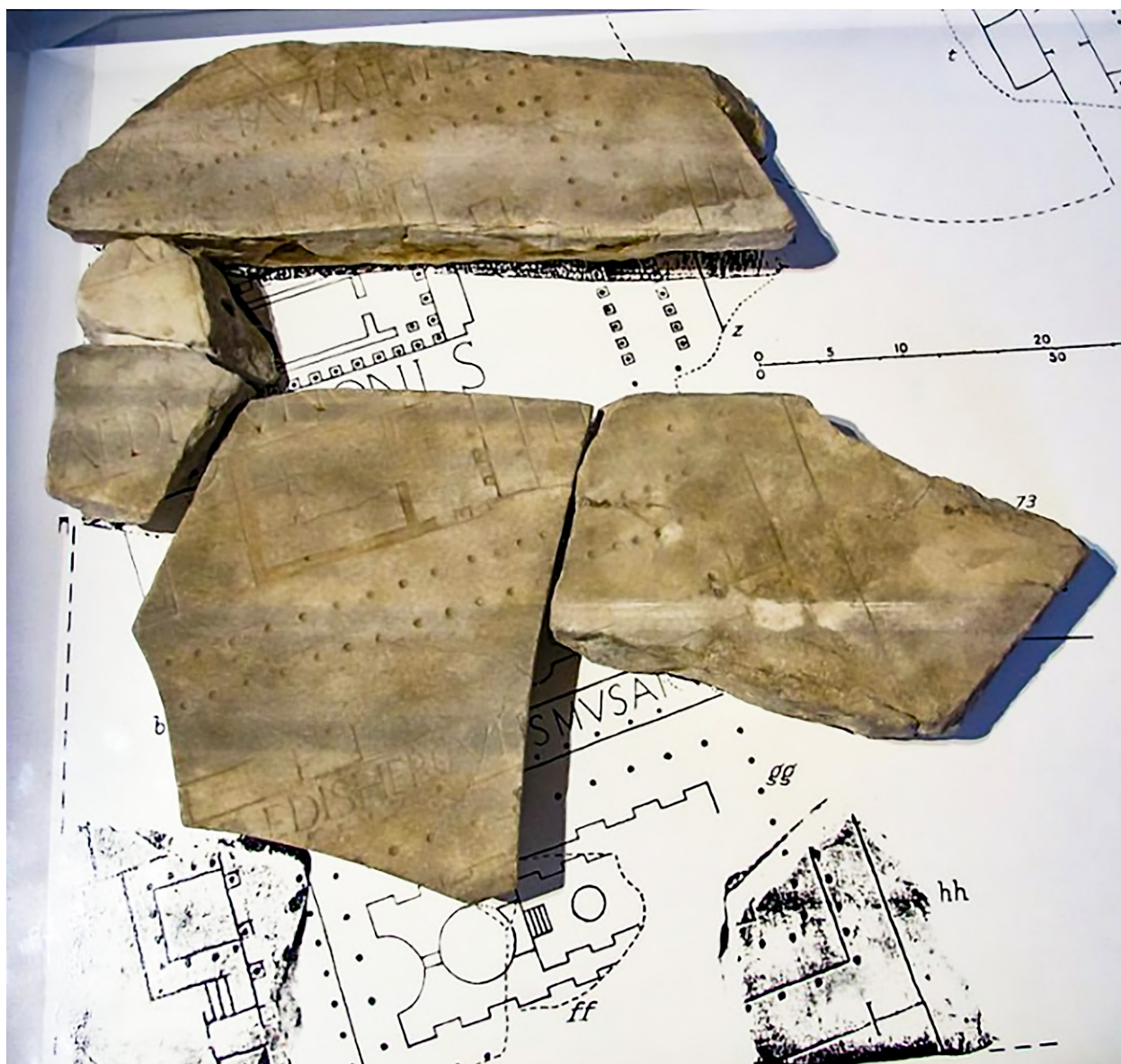
Ryc. 1. Fragmenty Forma Urbis Romae ze świątyniami znajdującymi się przy północnej krawędzi Cyrku Flaminiusza (wikimedia)

podium, które, aż do czasu publikacji jego badań określane było jako „tempio sconosciuto” 37 .